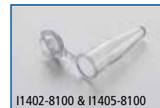
I1402-8100 & I1405-8100